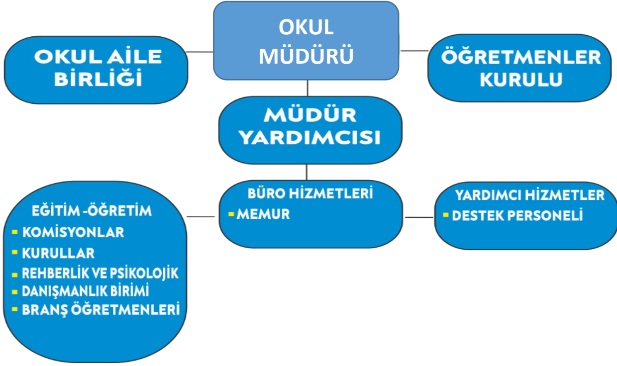
Temel Bilgiler Tablosu- Kurum Künyesi